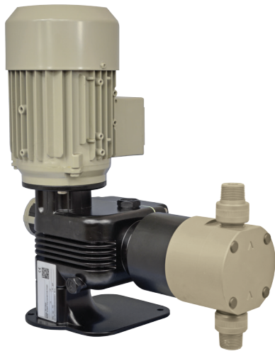
PRIUS P - PUMPENKÖRPER PP